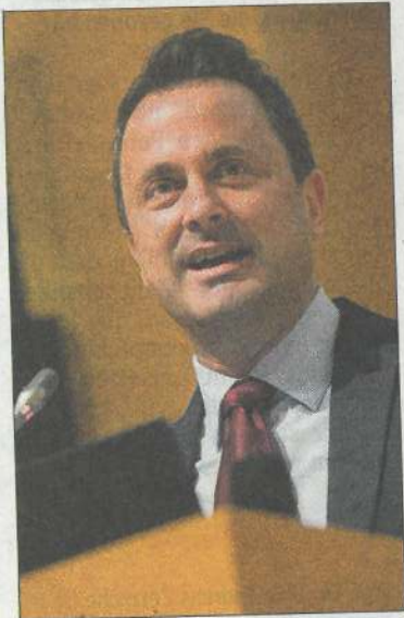
Xavier Bettel

Les entreprises, elles, peuvent déjà lutter contre les DDoS. Post a une offre depuis trois ans. Pour 250 à 1.000 euros par mois, selon le trafic à analyser par une boîte noire similaire, les entreprises voient le trafic néfaste bloqué jusqu'à huit heures mais les attaques ne durent que très rarement si longtemps. Luxair, l'aéroport, des banques de la place ou le CTIE auraient déjà souscrit à cette solution, qui offre aussi une solution aux demandes de rançon numérique, les ransomware, en transférant les données sans attendre le délai pour payer. Et c'est l'autre annonce du jour: l'Institut luxembourgeois de régulation va monitorer le nombre d'attaques, pour l'instant inconnu au Luxembourg.